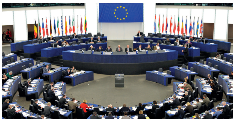
Zasedací sál Evropského parlamentu ve Štrasburku

Česká republika se poprvé evropských voleb zúčastnila v červnu 2004, krátce po svém vstupu do Evropské unie. Volby do Evropského parlamentu zde probíhají v souladu s volební tradicí v pátek a v sobotu. Na rozdíl od voleb do Poslanecké sněmovny Parlamentu ČR tvoří Česká republika pro evropské volby jeden volební obvod. To znamená, že strany sestavují jednu kandidátku pro celou Českou republiku. Právo volit má každý, kdo dosáhl věku 18 let. Právo být volen je přiznáno občanům po dosažení věku 21 let. Voleb do Evropského parlamentu se v České republice mohou účastnit také občané jiných členských států EU v případě, že v den konání voleb dosáhli minimální hranice 45 dnů přihlášení k trvalému nebo přechodnému pobytu v ČR.