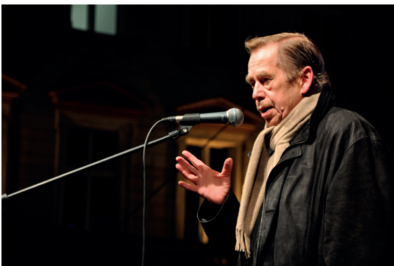
Prezident Václav Havel během oslav výročí 17. listopadu v roce 2009

Prezidentské kandidáty může navrhnout skupina nejméně 20 poslanců nebo 10 senátorů. Stejně právo mají i plnoletí občané, kteří také mohou navrhnout kandidáty. Jejich návrh ale musí podpořit petice s nejméně 50 tisíci podpisy. Volit pak může v tajné volbě každý občan starší 18 let. Pokud některý kandidát získá už v prvním kole nadpoloviční většinu hlasů, vítězí. Pakliže ale nikdo takový počet hlasů nezíská, musí se do 14 dnů konat druhé kolo volby, do kterého postoupí dva nejúspěšnější kandidáti. Prezidentem se stává ten, který získá více hlasů.