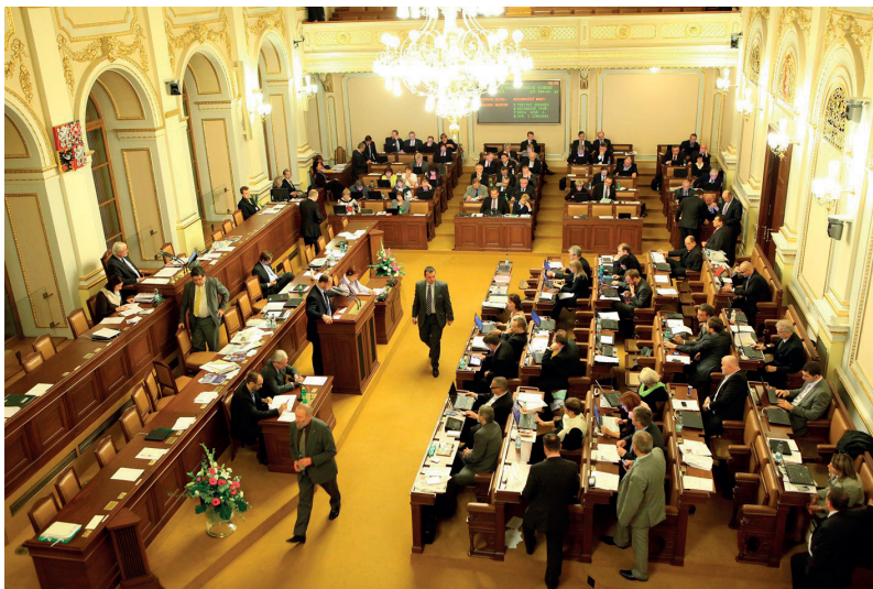
Zasedání Poslanecké sněmovny Parlamentu České republiky

Největší politický vliv na utváření podoby české společnosti má Poslanecká sněmovna Parlamentu ČR, která přijímá zákony, vyslovuje důvěru vládě, může také zřizovat vyšetřovací komise a volí členy mediálních rad.