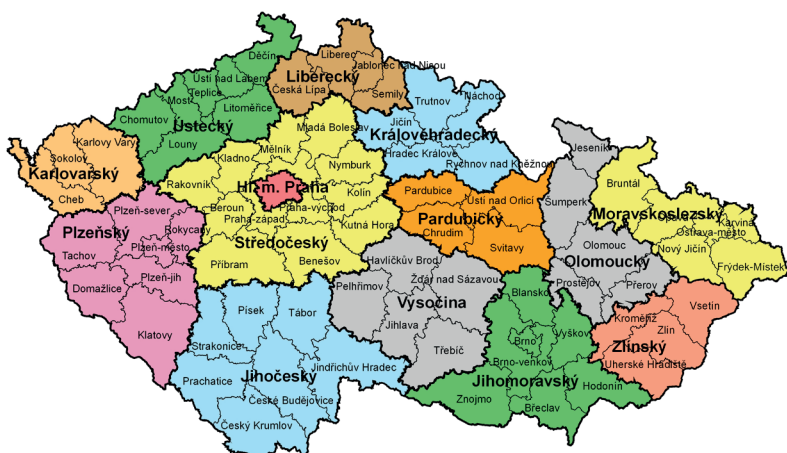
Mapa krajů České republiky

Stejně jako u obcí i v krajích ze zastupitelstva vznikne krajská rada, ta si pak volí představitele kraje – hejtmana. Rady krajů vznikají na základě politických dohod zvolených stran. Zastupitelstva krajů mohou rovněž předkládat návrhy zákonů Poslanecké sněmovně Parlamentu ČR.