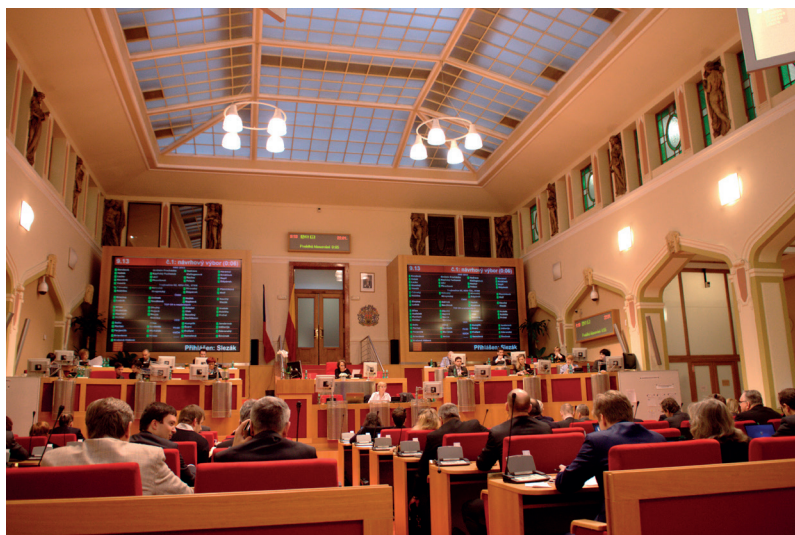
Zasedání zastupitelstva Magistrátu hlavního města Prahy

Vedle práv mají kraje samozřejmě i své povinnosti. Zajišťují například veřejnou dopravu mezi městy a starají se o všechny silnice II. a III. třídy na svém území. Stejně tak je věcí krajů i oblast školství, sociální a zdravotní péče nebo kultury. Zde stojí za zmínku to, že kraj odpovídá za provoz všech státních středních škol. Kraje také zřizují a řídí své vlastní příspěvkové organizace – většinou to jsou muzea, galerie nebo centra sociální péče, krizové telefonické linky, domovy pro osoby se zdravotním postižením nebo domovy pro seniory.