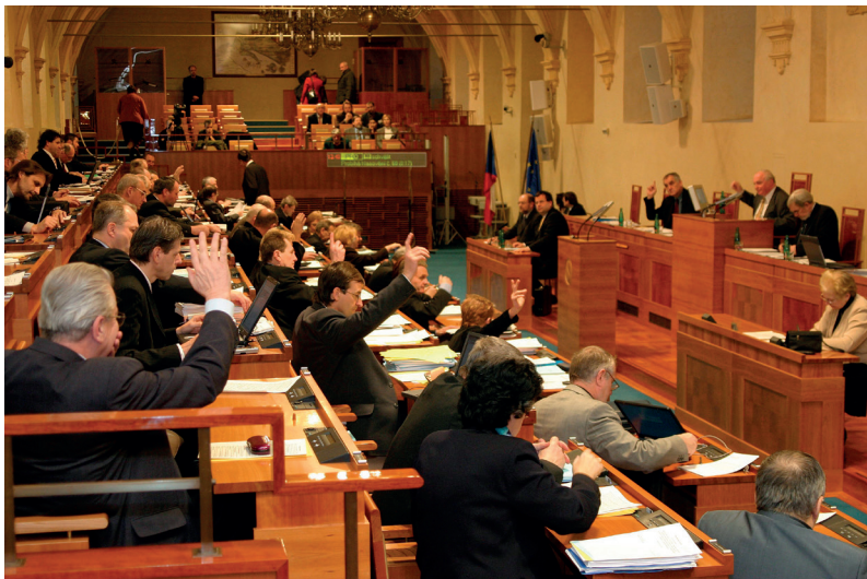
Zasedání Senátu Parlamentu České republiky

Senát má i specifické pravomoci, kterými nedisponuje sněmovna.