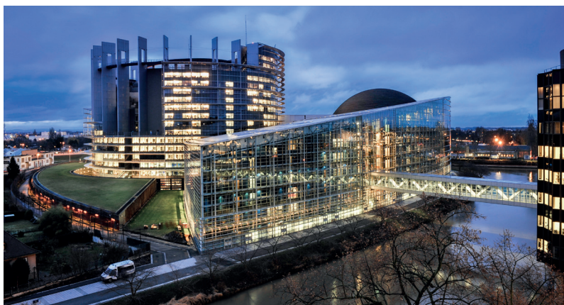
Budova Evropského parlamentu ve Štrasburku

Evropský parlament (EP) je jedním ze stálých orgánů Evropské unie (EU). Reprezentuje zájmy občanů EU, kteří volí jeho členy v přímých volbách. Je tak orgánem, který v institucionálním rámci EU představuje základní demokratický prvek. Evropský parlament své aktivity vykonává zejména v Bruselu, ale také ve Štrasburku a v Lucemburku.