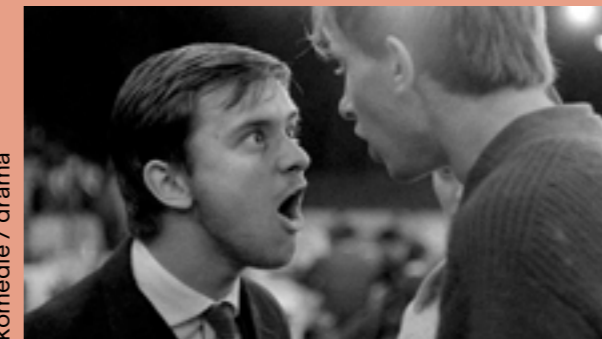
komedie / drama