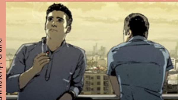
animovaný / drama

SCÉNÁŘ A REŽIE: ALI SOOZANDEH. KAMERA: MARTIN GSCHLACHT. HRAJÍ: ARASH MARANDI, ALIREZA BAYRAM. OCENĚNÍ: CENA ZA NEJLEPŠÍ DEBUT NA MFF V JERUZALÉMĚ