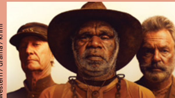
western / drama / krimi

REŽIE A KAMERA: WARWICK THORNTON. HRAJÍ: HAMILTON MORRIS (DOMORODÝ CHOVATEL DOBYTKA SAM), SAM NEILL (FRED), BRYAN BROWN (SERŽANT FLETCHER), GIBSON JOHN (DOMORODÝ STOPAŘ ARCHIE)