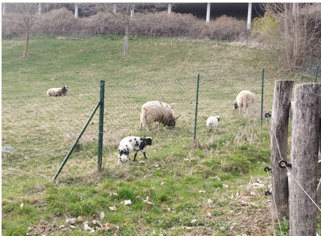
Schäfe in Zotter Schokoladenfabrik

Als die Zeit kam, Abschied zu nehmen, war ich dankbar für die schönen Erinnerungen und die Erfahrungen, die ich in Graz gemacht habe. Ich hoffe, eines Tages zurückzukehren, um noch mehr von dieser faszinierenden Stadt zu entdecken.