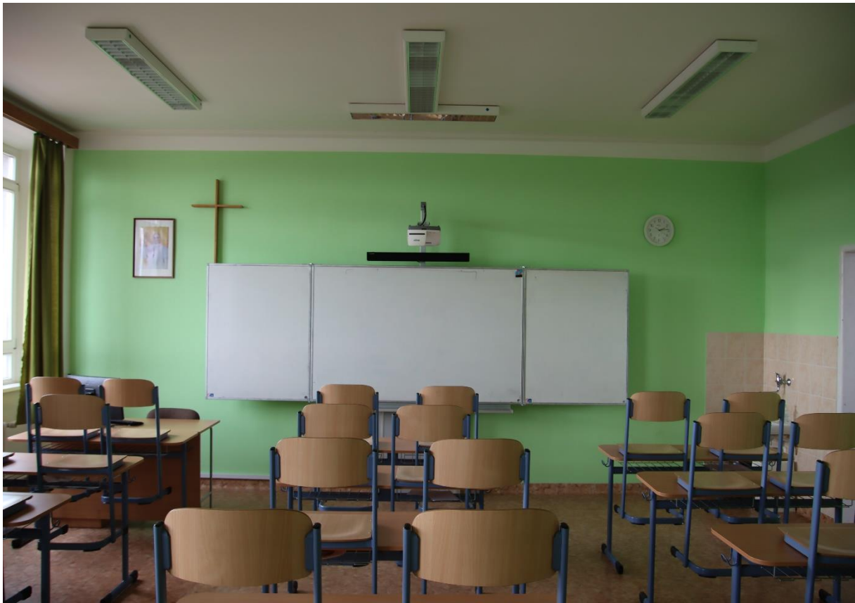
Na snímcích vidíme jednu z nových učeben ve 4. patře (č. 435) včetně detailu na technickou výbavu.