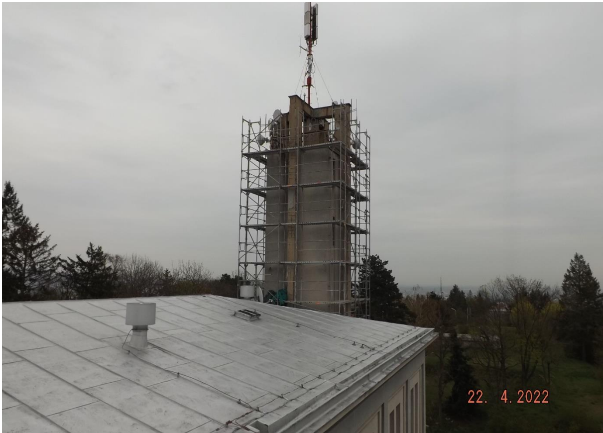
Lešení se stavělo 3 dny.