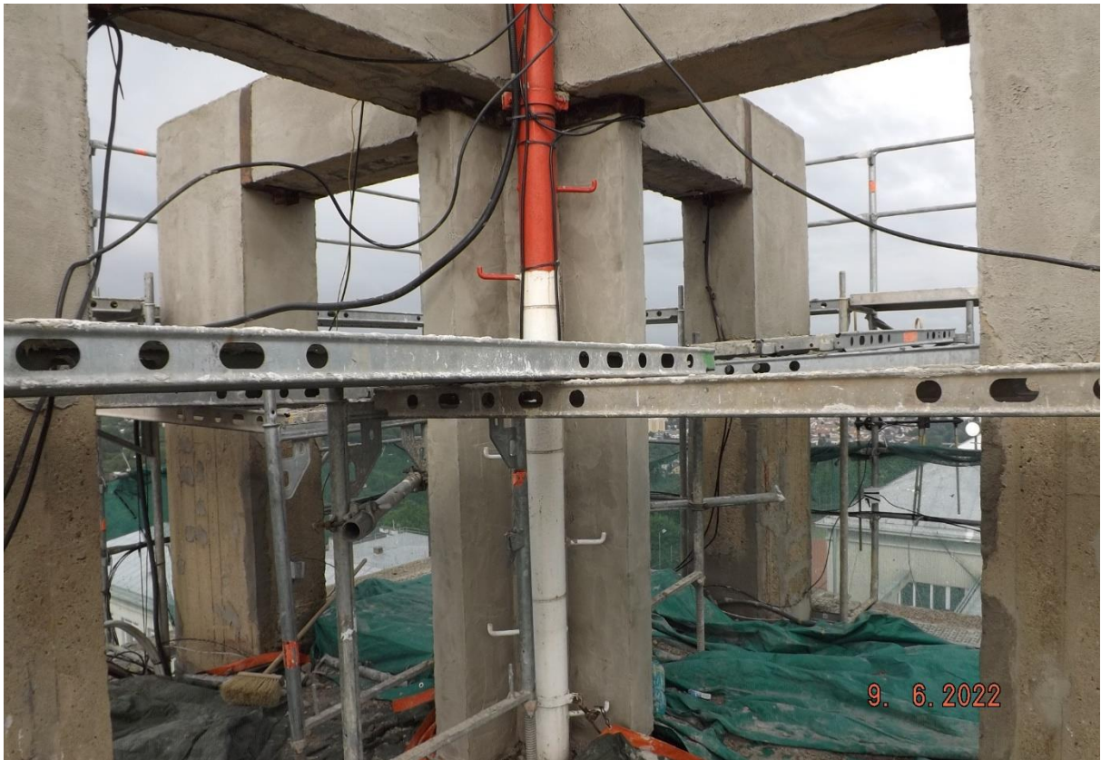
Byla zpevněna a nově oplechována také nosná konstrukce vysílacích antén.