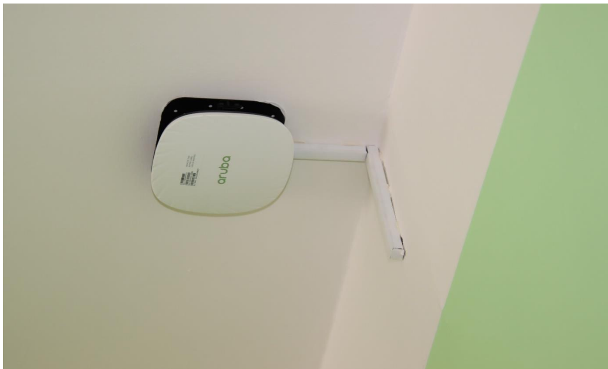
Pohled na modul Wifi od firmy Aruba a pohled na jeho zakomponování v učebně

Dokoupili jsme moduly WiFi pro dokrytí školy. Dokryty byly především společné prostory školy s některé třídy, kde dosud nebyl signál. Signálem WiFi je nyní pokryta již zhruba celá škola. Cena dokrytí signálem WiFi byla 250000 Kč, dodala firma Stofcom.