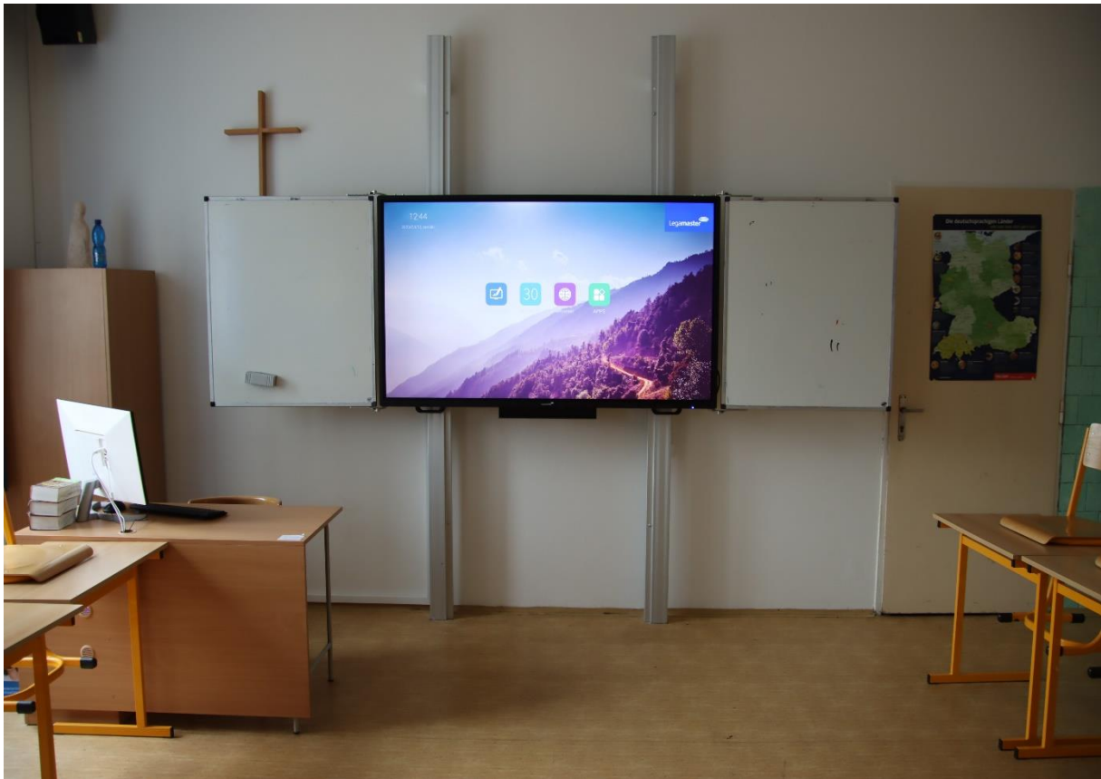
Nově osazené učebny, nahoře učebna č. 162 (němčina) a dole učebna č. 211 (angličtina).