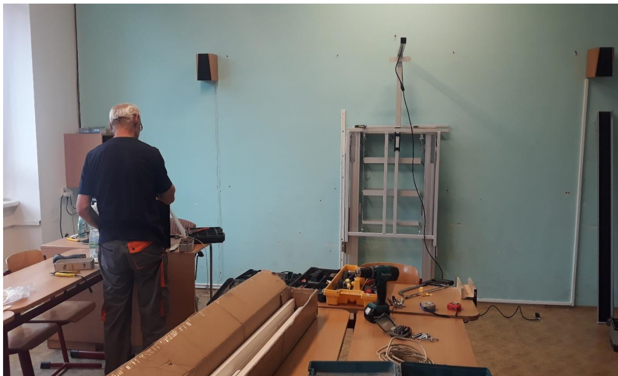
Fotografie z montáže LCD tabulí v jazykových učebnách.

Společně s 3. etapou modernizace technické výbavy se podařilo dokončit i 4. etapu, která zahrnovala technickou výbavu v jazykových učebnách. V této etapě se montovaly převážně LCD tabule, které montovala firma Consulta. Cena montáže 4. etapy byla 460000 Kč. K novým tabulím se muselo nově udělat i síťové připojení, o které se postarala naše údržba.