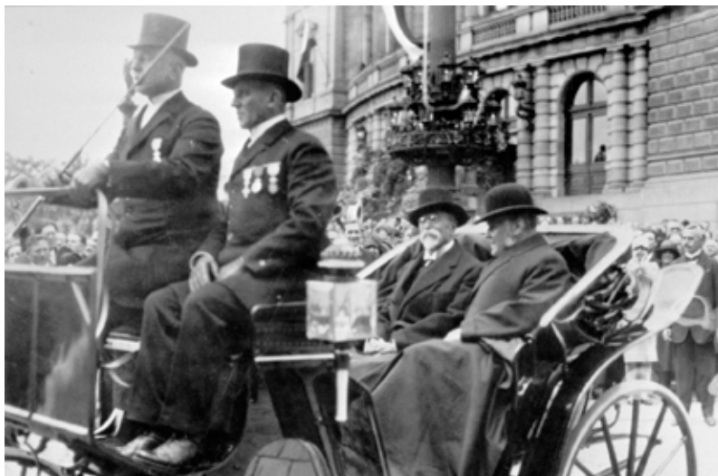
Nově zvolený československý prezident Tomáš Garrigue Masaryk a ministerský předseda Antonín Švehla (vpravo) odjíždějí od budovy parlamentu (Rudolfinum) po volbě prezidenta roku 1927.

Po vypuknutí první světové války se národnostní rozpory v monarchii ještě prohloubily. Už v létě 1915 zahájil profesor Tomáš Garrigue Masaryk své zahraniční aktivity směřující k založení nového státu. O rok později vznikla v Paříži Národní rada. Ale forma budoucího českého, respektive československého státu se v té době ještě hledala. Jednou z uvažovaných možností bylo i království. Po vzniku samostatného Československa 28. října 1918 bylo jisté, že zvítězilo republikánství; monarchismus byl už tehdy považován za zastaralý. Rozšířením Národního výboru československého vzniklo Revoluční národní shromáždění, do něhož byli povoláni další zástupci na základě výsledků posledních předválečných voleb v Rakousku-Uhersku. A také kooptování zástupci Slovenska.