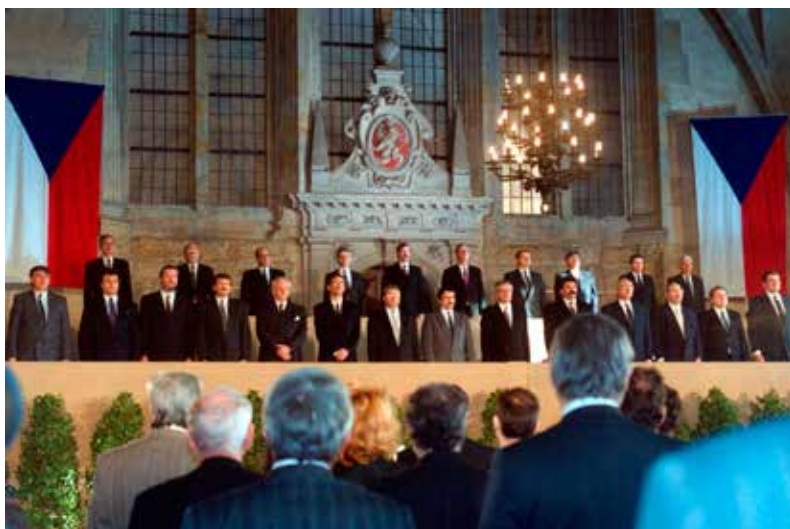
Slavnostní schůze Poslanecké sněmovny Parlamentu ČR ve Vladislavském sále Pražského hradu při příležitosti vzniku České republiky, 1. 1. 1993

Největší politický vliv na utváření podoby české společnosti má Poslanecká sněmovna Parlamentu ČR, která přijímá zákony, vyslovuje důvěru vládě, může také zřizovat vyšetřovací komise a volí členy mediálních rad.