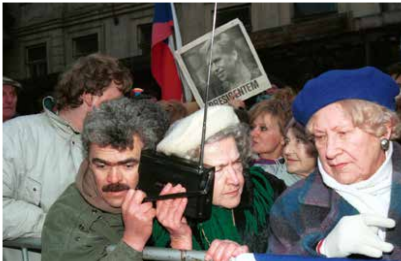
Stoupenci Václava Havla před Poslaneckou sněmovnou během volby prezidenta ČR v roce 1993

Pokud některý kandidát získá už v prvním kole nadpoloviční většinu hlasů, vítězí. Jestliže ale nikdo takový počet hlasů nezíská, musí se do 14 dnů konat druhé kolo volby, do kterého postoupí dva nejlépeší kandidáti. Prezidentem se stává ten, který získá více hlasů.