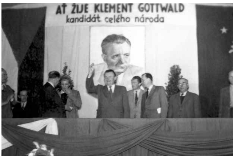
Předvolební projevy předsedy vlády Klementa Gottwalda, náměstka předsedy vlády Antonína Zápotockého a ministra sociální péče Evžena Erbana v jinonické Waltrůvce v květnu 1948

Skutečná rozhodnutí ovlivňující chod státu se tak činila nejen mimo standardní ústavní orgány, ale dokonce i mimo hranice země.