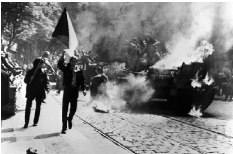
21. srpna 1968 do Československa vstoupila vojska Varšavské smlouvy v čele s armádou Sovětského svazu. Na snímku lidé demonstrativně mávají československou vlajkou před hořícím sovětským tankem před budovou rozhlasu na Vinohradské třídě v Praze.

Moc ve skutečnosti neměla ani vláda. Vše řídila komunistická strana, v jejímž čele většinou stál prezident republiky. Zemi tak řídila hrstka lidí, kteří byli odstřiženi od veřejnosti i od reality. Všechny protesty a pokusy zakládat opoziční strany končily šikanou, zastrasováním a často i vězením. Nejbližší bylo Československo obnově pluralitnějšího systému v roce 1968, ale invaze vojsk Varšavské smlouvy všechny demokratizační pokusy potlačila.