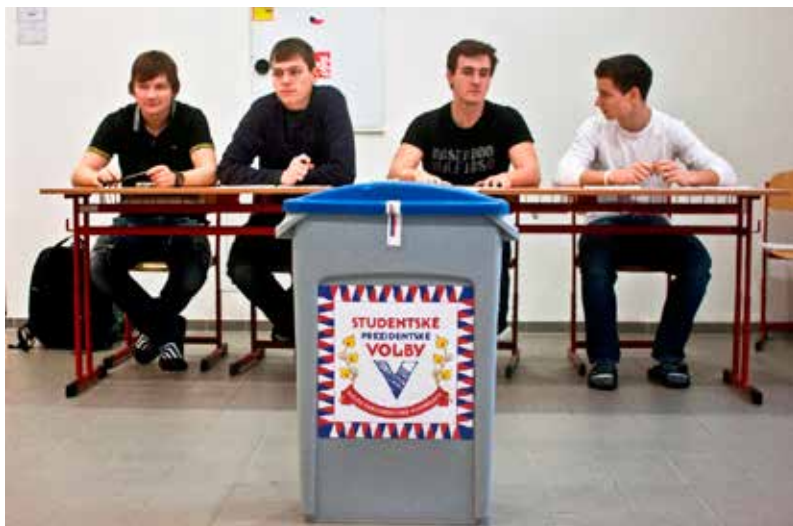
Studentské prezidentské volby proběhly v prosinci 2012. Zúčastnili se jich středoškoláci ze 441 škol. Na snímku jsou zástupci studentské volební komise Gymnázia Jateční v Ústí nad Labem.

Je tedy zřejmé, že existuje mnoho způsobů, jak mladé lidi zaujmout, povzbudit, jak je motivovat, aby formulovali své postoje a názory, aby konali. Právě o to se snažíme a pro vás pedagogy připravujeme konkrétní praktické pomůcky. Registrací na našem audiovizuálním vzdělávacím portálu jsns.cz zdarma získáte přístup k audiovizuálním lekcím, které můžete využít přímo v hodinách pro práci s žáky nad nejrůznějšími tématy. Na portálu najdete i publikace s přehledem nástrojů občanské angažovanosti, s praktickými radami a doporučeními a také přehled zdařilých projektů jako motivaci pro projekty budoucí. Při našich aktivitách se snažíme poukazovat na to, že popisování náctiletých coby povrchních konzumentů, kteří se chtějí jen bavit a užívat si, je dlouhodobě zažitým zkreslujícím stereotypem.