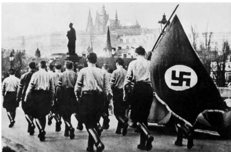
Nacisté pochodují přes Karlův most v Praze v době druhé světové války

Na druhé straně existovalo ve válečném období Prozatímní státní zřízení ČSR, které reprezentovala politická emigrace v Londýně v čele s Edvardem Benešem.