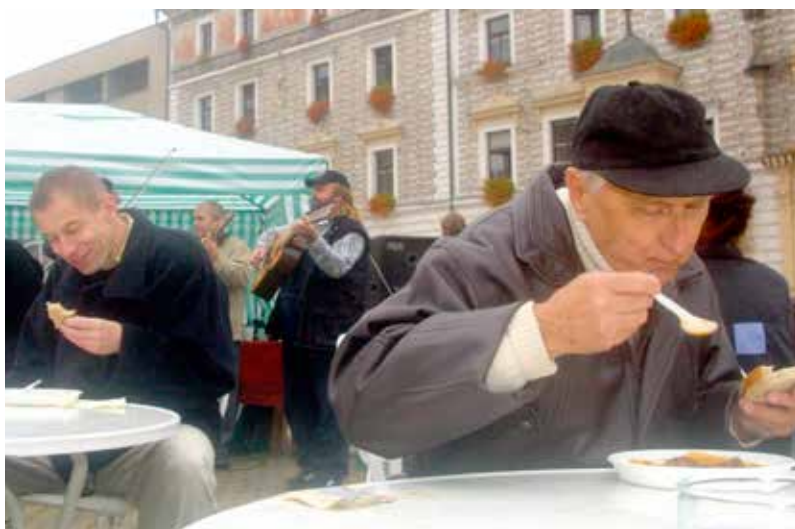
Volební kampaň před komunálními volbami v roce 2002

U voleb parlamentních, krajských i komunálních, ve kterých se volí politické strany, uskupení a koalice, existuje část voličů, kteří tradičně a dlouhodobě inklinují k určité politické straně či uskupení. Na volební preference této specifické skupiny voličů mají tak mediální prezentace jednotlivých politických stran či kandidátů zanedbatelný vliv.